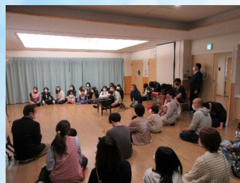
5月に開かれた全体会の様子